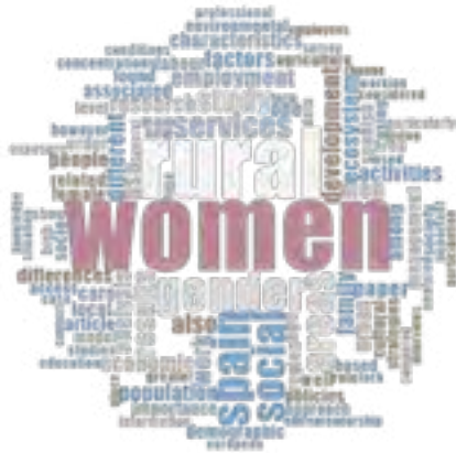
Figura 1.1 Nube de palabras construida a partir de los resúmenes de los 68 artículos analizados para el mapa sistemático.

en las características, contribuciones, puntos de vista, experiencias, conocimientos y desafíos de las pastoras y ganaderas en España. No se identificaron artículos que abordaran específicamente estos temas, aunque varios de ellos se centraran en el tema más amplio de la mujer en la agricultura.