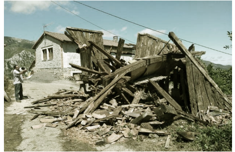
IMAGEN 03. Estado en el que quedó el hórreo de El Pedrosu en Vis, Amieva (Asturias). / El Comercio (6 de junio 2020)

Horreos y paneras como metáfora de adaptación, vitalidad, reactivación, de espacio común, de valores como la reciprocidad o la responsabilidad compartida. Conceptos y valores que deberían estar siempre asociados a nuestra idea de patrimonio. Además, en hórreos y paneras se dan una serie de encuentros y equilibrios de los que aprender: arraigados a la tierra, son móviles y se elevan al cielo. Son oscuras cajas de madera en su interior, pero se abren al paisaje que las circunda por puertas y ventanucos. Son silenciosas, pero actúan como cajas de resonancia. Son cabañas para pensar (1) y un espacio íntimo, aunque debajo de ellas el espacio abierto ha sido siempre espacio de socialización (fiestas, trabajos agrícolas colectivos). Un juego constante entre lo comunitario y lo personal, la penumbra y la luz, la reflexión y la producción, el contacto y la distancia, lo funcional y lo lúdico, lo terrenal y lo espiritual.