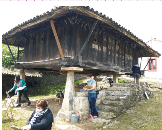
IMAGEN 09. Tomando notas y realización de frottage en el hórreo (1851) y panera (1817) de casa Elena, Sotiello. Agropolitana 2021.