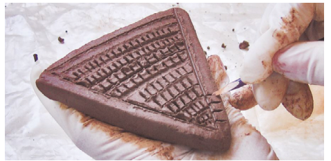
IMAGEN 05. Impresión en taller de una pintadera canaria / Museo Canario.