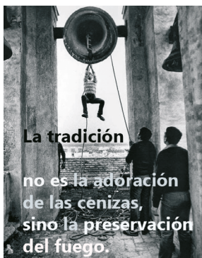
IMAGEN 02. "La tradición no es la adoración de las cenizas, sino la preservación del fuego". Jaime Izquierdo.