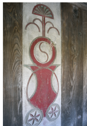
IMAGEN 10. Detalle de decoración tallada en la colondra de la panera (1861) de casa Manolo el maestro, Cenero. Agropolitana 2021.