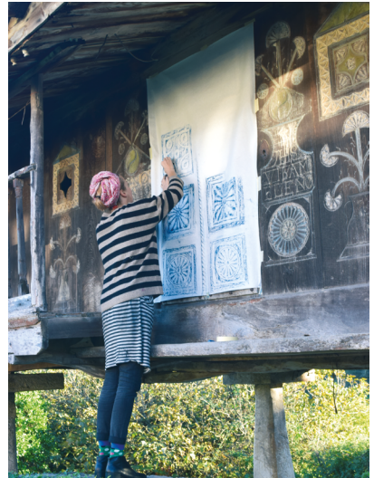
IMAGEN 14. Frottage en el hórreo (1851) de casa Elena, Sottielo. Agropolitana 2021.