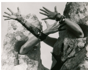
IMAGEN 06. Combat de pierres de Claude Cahun, 1931