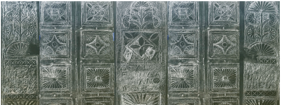
IMAGEN 11. Digitalización del frottage realizado en la panera (1856) de casa Pereda, Trubia. Virginia López, Agropolitana 2021.