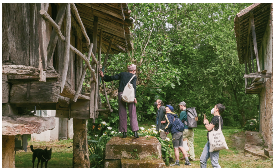
IMAGEN 12. Paseo por hórreos y paneras de Cenero. Agropolitana 2021.

Es importante escuchar las memorias e historias de las personas que habitan el lugar... intercambiar información. Llevaremos un cuaderno de campo para tomar notas, y una persona del grupo registrará los paisajes sonoros y testimonios orales. Es curioso confrontar estas arquitecturas tradicionales con los paisajes sonoros que habitan: detenernos individualmente en una escucha atenta (y por tanto en silencio) nos hará conscientes del contexto sonoro en el que estamos “obligatoriamente” inmersos y considerar los cambios que quizás los modos de vida modernos y la industrialización han provocado en nuestros entornos rurales.