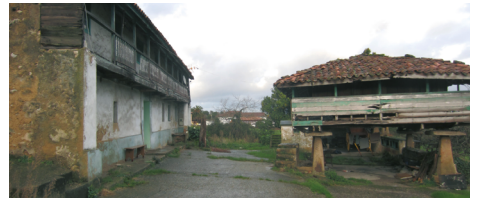
IMAGEN 04. Quintana tradicional en la aldea de Trubia. (Una de tantas caserías silenciosas... )