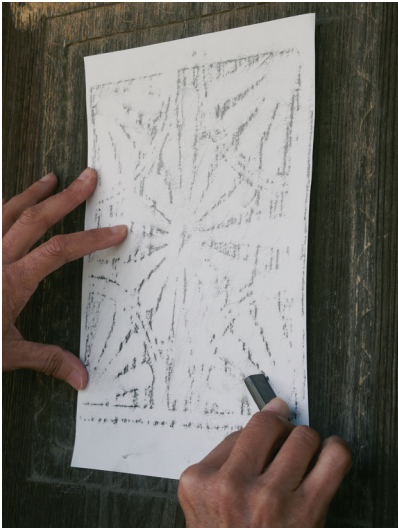
IMAGEN 13. Recolección de texturas con frottage en la panera (1856) de casa Pereda, Trubia. (17 abril 2021, Agropolitana)

Lo primero es observar, tocar, entrar, moverse. Una práctica sencilla y que hemos adoptado en Agropolitana es la técnica del frottage , no es necesario tener una particular habilidad técnica o artística y los resultados son excepcionales: un archivo por contacto que recoge texturas, reproduce en escala 1:1 motivos decorativos tallados, cerraduras, oquedades, vetas ( IMAGEN 12, 13 ). Una vez en el aula, los frottage se pueden digitalizar ( IMAGEN 11 ). En Agropolitana hemos realizado pequeños frottage durante los paseos y se han terminado reproduciendo los frentes de las paneras, todas con tallas de estilo Carreño, en escala 1:1.