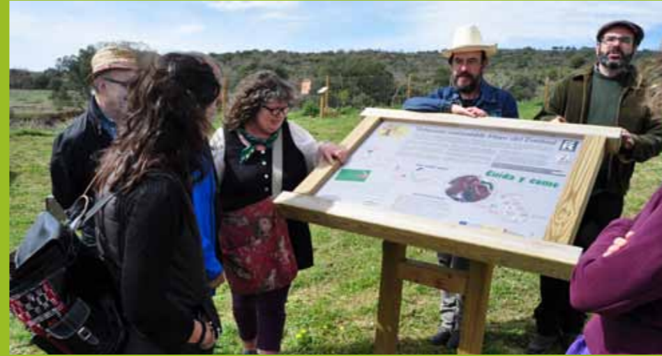
Lugar demostrativo agroecológico del municipio fundador de Red TERRAE