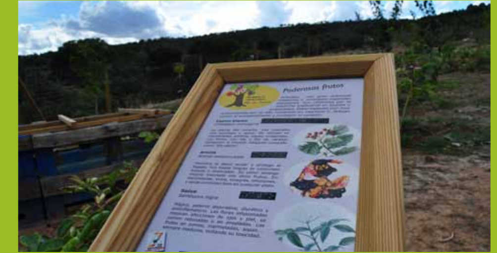
Incorporación como recurso turístico etnobotánico y gastronómico

Espacio de integración vecinal y recuperación del espíritu comunal Espacio de integración vecinal y recuperación del espíritu comunal Espacio de integración vecinal y recuperación del espíritu comunal Espacio de integración vecinal y recuperación del espíritu comunal Espacio de integración vecinal y recuperación del espíritu comunal Espacio de integración vecinal y recuperación del espíritu comunal