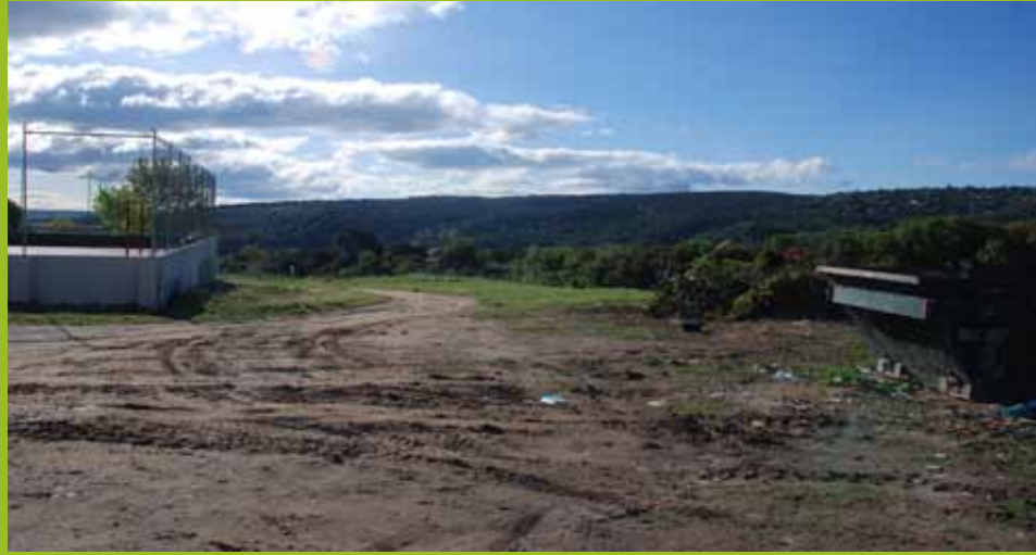
Regeneración de espacio degradado

Espacio de integración vecinal y recuperación del espíritu comunal Espacio de integración vecinal y recuperación del espíritu comunal Espacio de integración vecinal y recuperación del espíritu comunal Espacio de integración vecinal y recuperación del espíritu comunal Espacio de integración vecinal y recuperación del espíritu comunal Espacio de integración vecinal y recuperación del espíritu comunal