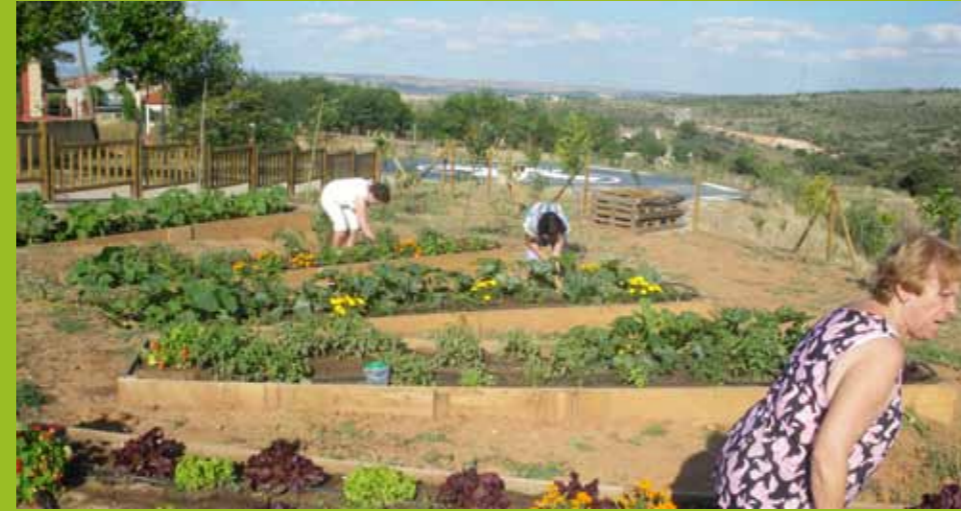
Espacio de integración vecinal y recuperación del espíritu comunal