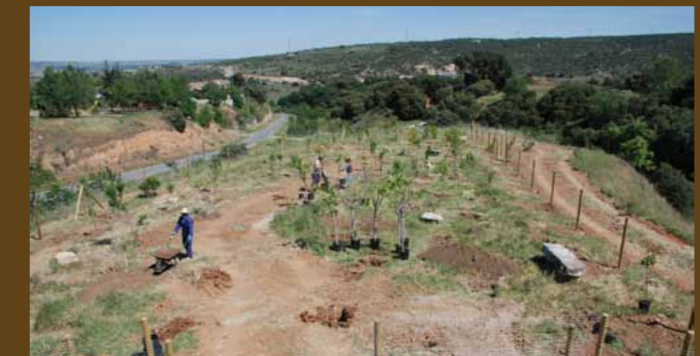
Plantación de especies comestibles adaptadas