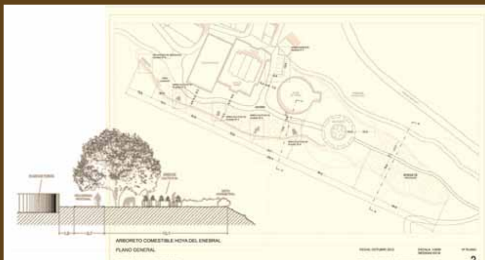
Anteproyecto urbano arquitectónico