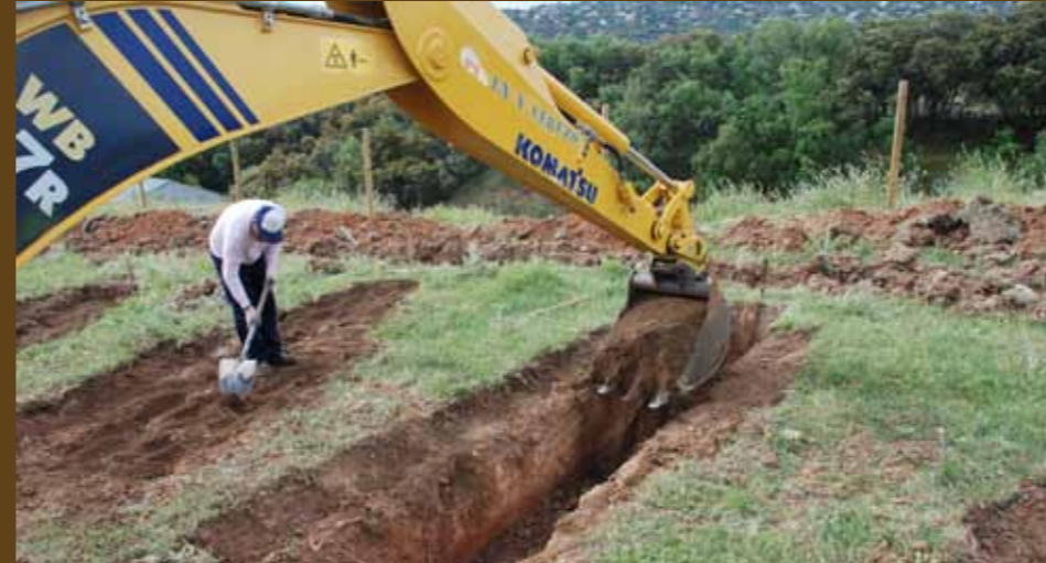
Regeneración profunda del terreno